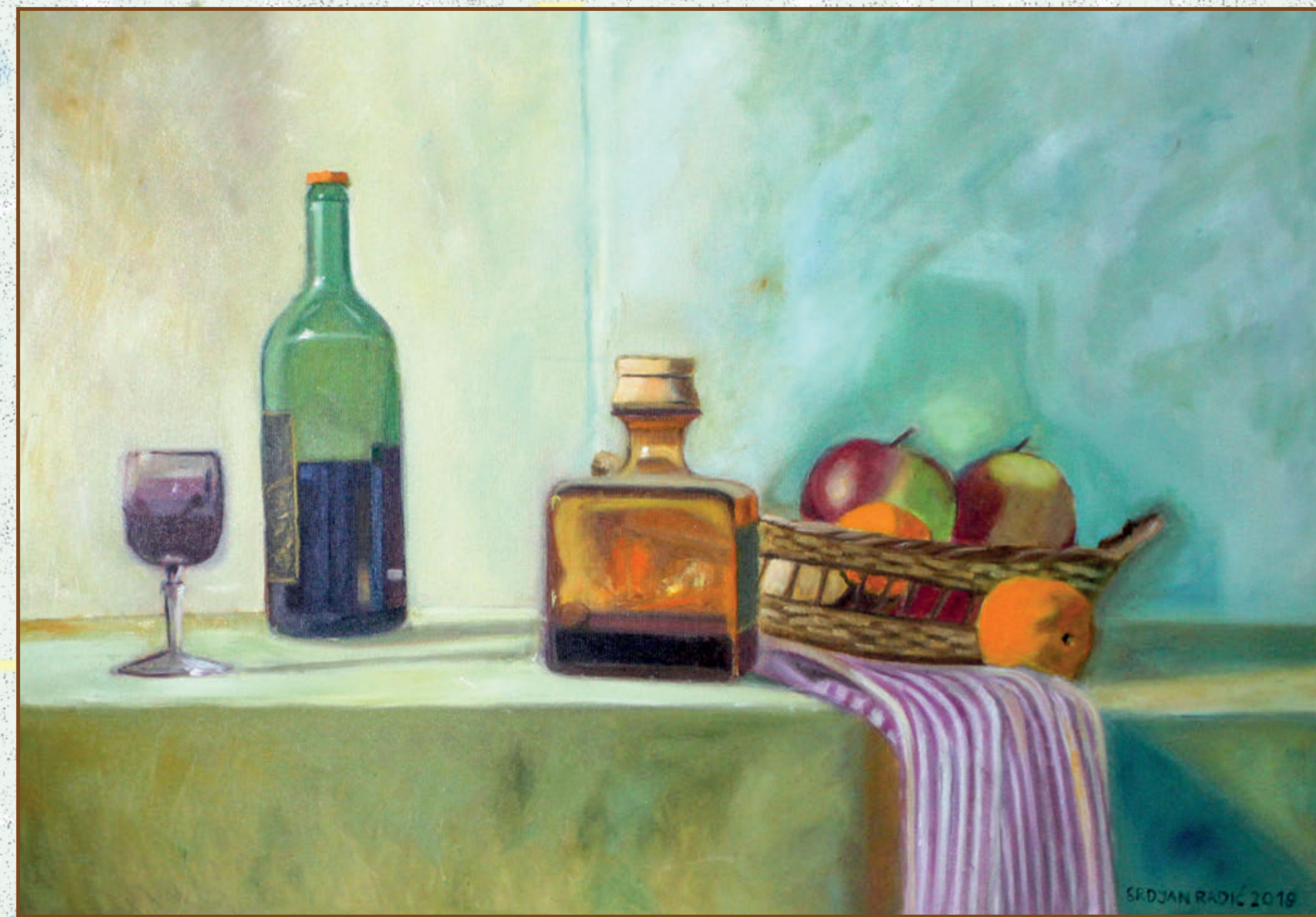
Mrtva priroda ulje na platnu 80x60 cm 2019. god.