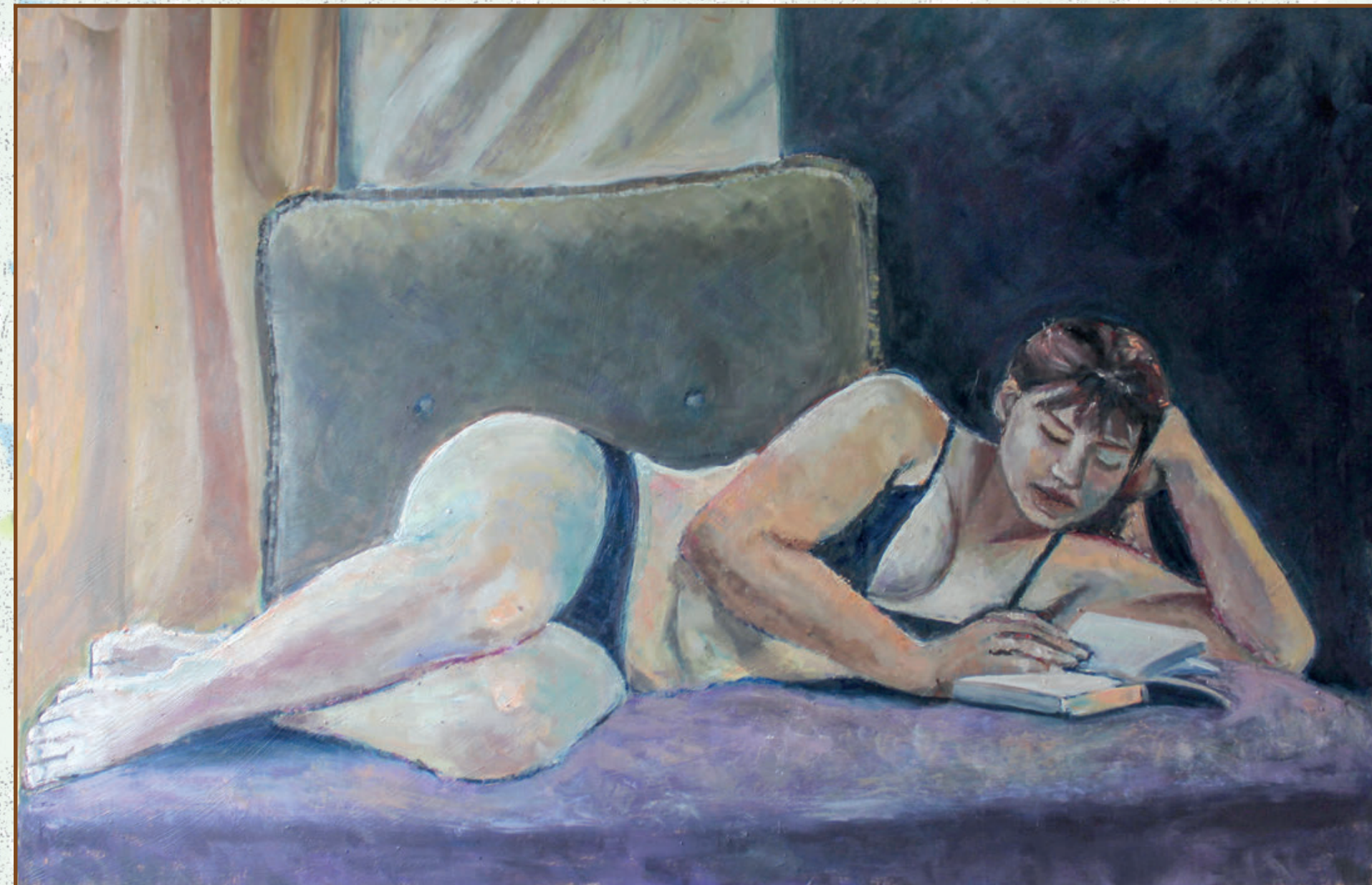
Drugarica ulje na platnu 100x70 cm 2019. god.