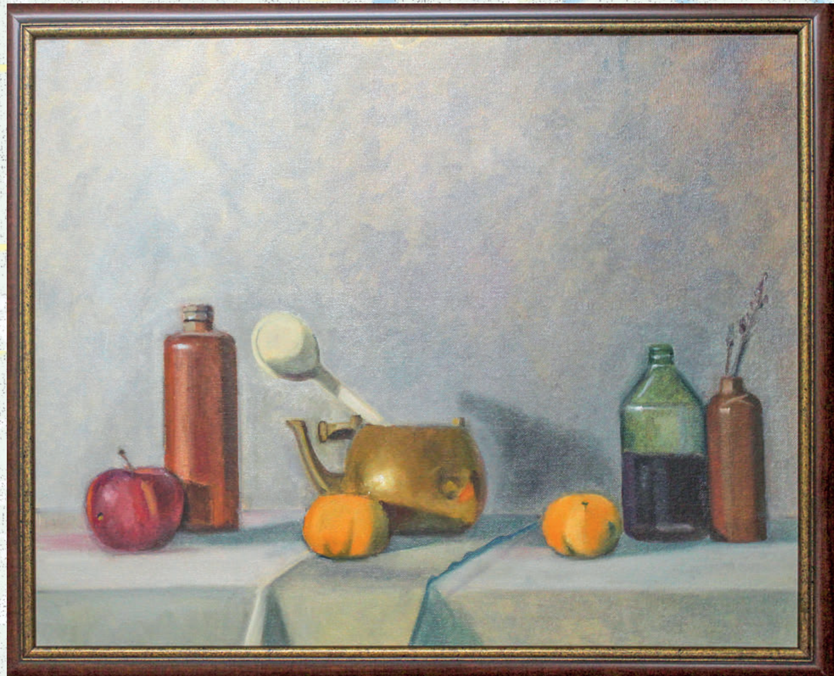
Mrtva priroda ulje na platnu 80x60 cm 2019. god.