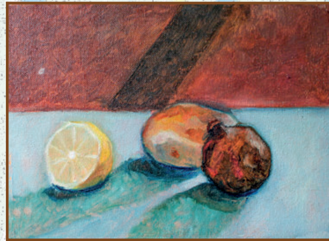
Mrtva priroda ulje na platnu kaširano na karton 30x20 cm, 2018. god.