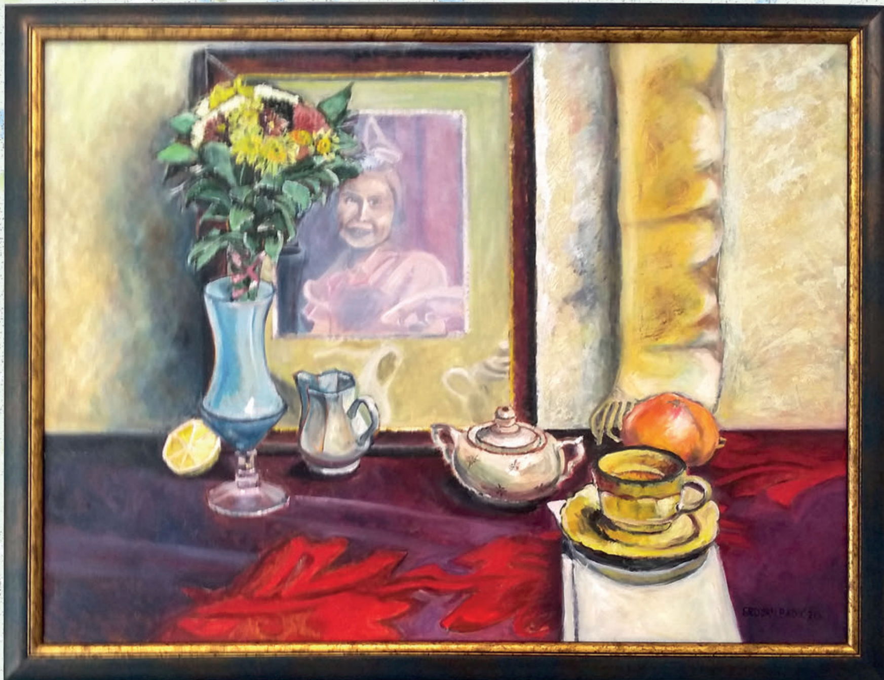
Mrtva priroda ulje na platnu 80x60 cm 2020. god.