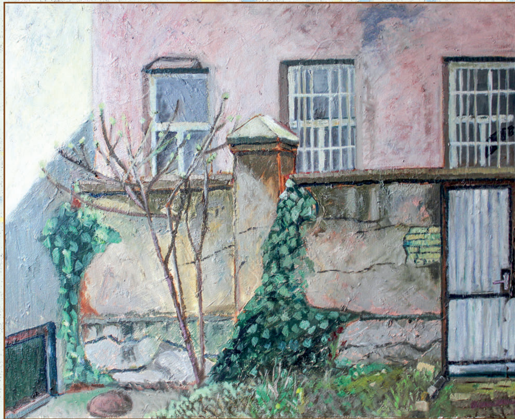
S ove strane zida ulje na platnu 60x50 cm 2020. god.