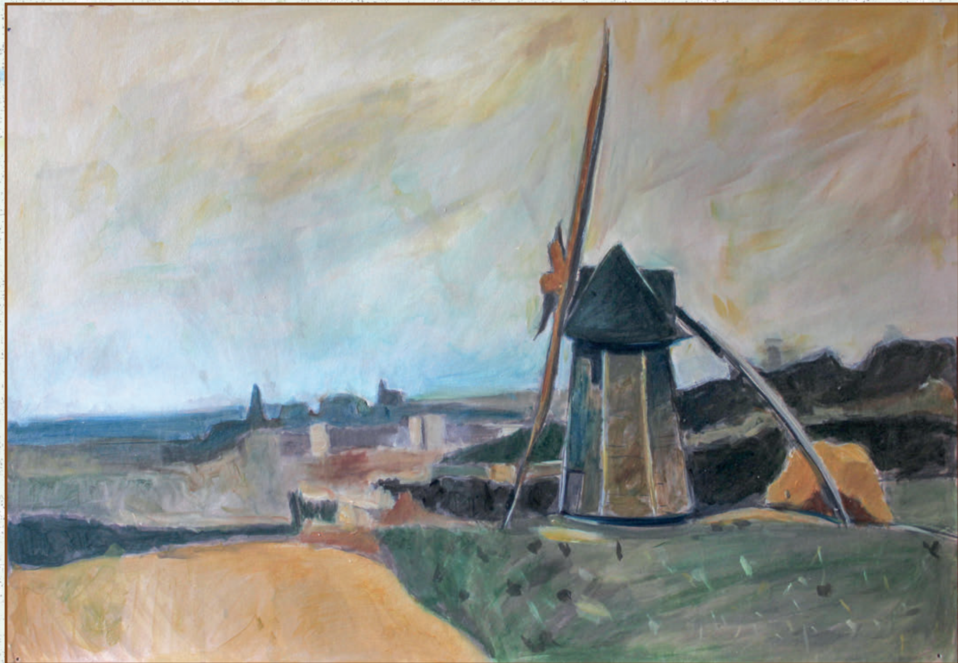
Vetrenjača (kopija) ulje na platnu 60x40 cm 2019. god.