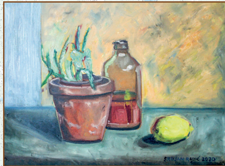
Mrtva priroda ulje na platnu 40x30 cm 2018. god.