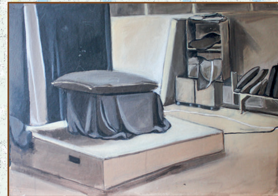
Pastel 2019-20. god.