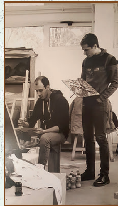
U ateljeu Edukons 2019. god.