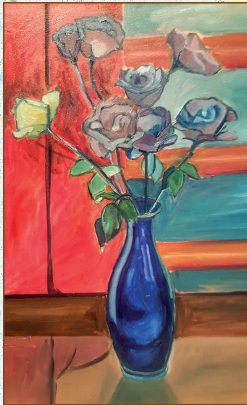
Cveće , ulje na platnu, 50x30 cm, 2018. god. privatna kolekcija Dudić