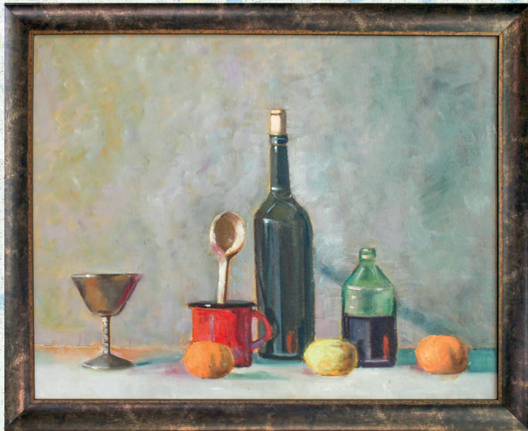
Mrtva priroda ulje na platnu 70x50 cm 2019. god.