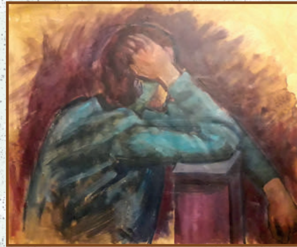
Razmišlja ulje na platnu kaširano na karton 40x30 cm, 2018. god.