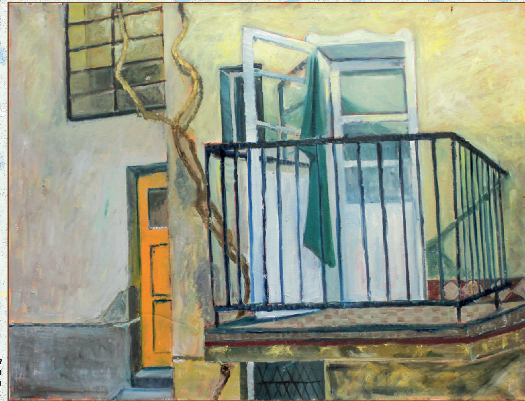
Jasnina terasa ulje na platnu 80x60 cm 2020. god.